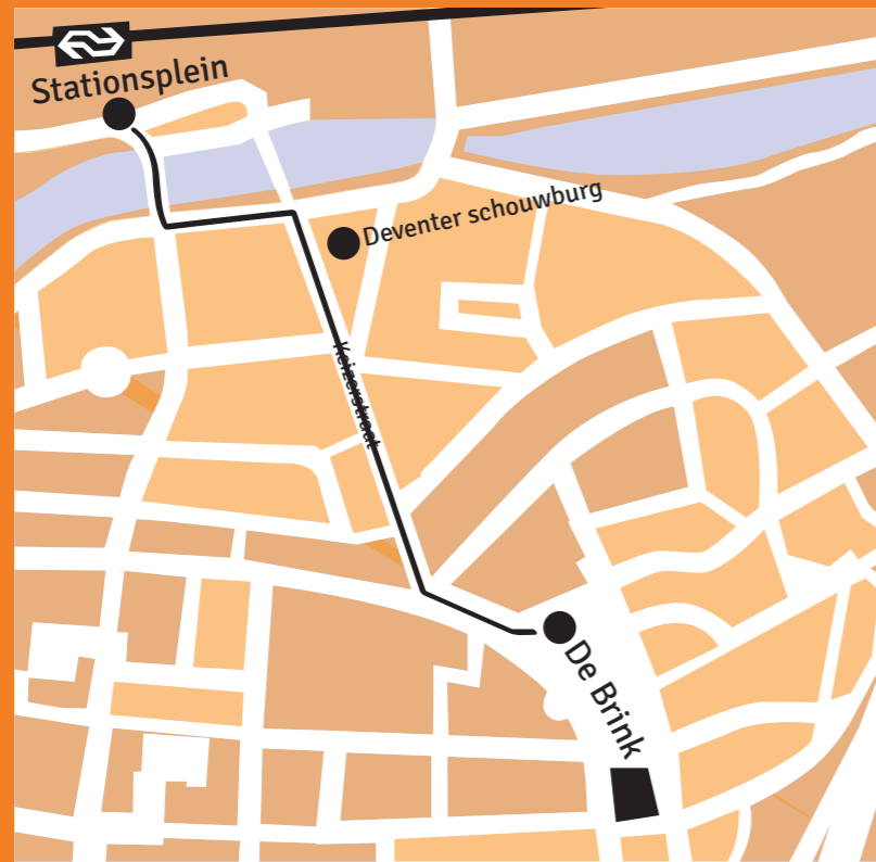
looproute (vannaf het station) naar de Brink te Deventer.